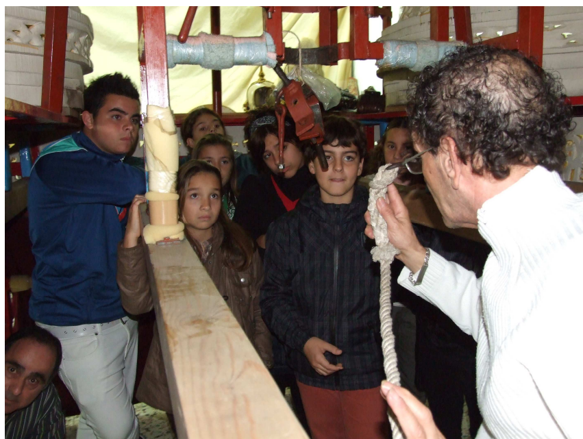
EL GRUPO ATENTO A LAS EXPLICACIONES EN LA CONFERENCIA DE MONTAJE Y DESMONTAJE DE PASOS

Los días 3 y 4 de Diciembre colaboramos en una campaña benéfica solidarizándonos con los más necesitados del barrio, recogiendo alimentos donados por gente de buen corazón en diversas entidades de nuestro entorno, que gentilmente nos cedieron un lugar en sus instalaciones, siendo posteriormente entregados dichos alimentos a Cáritas Parroquial para su distribución.