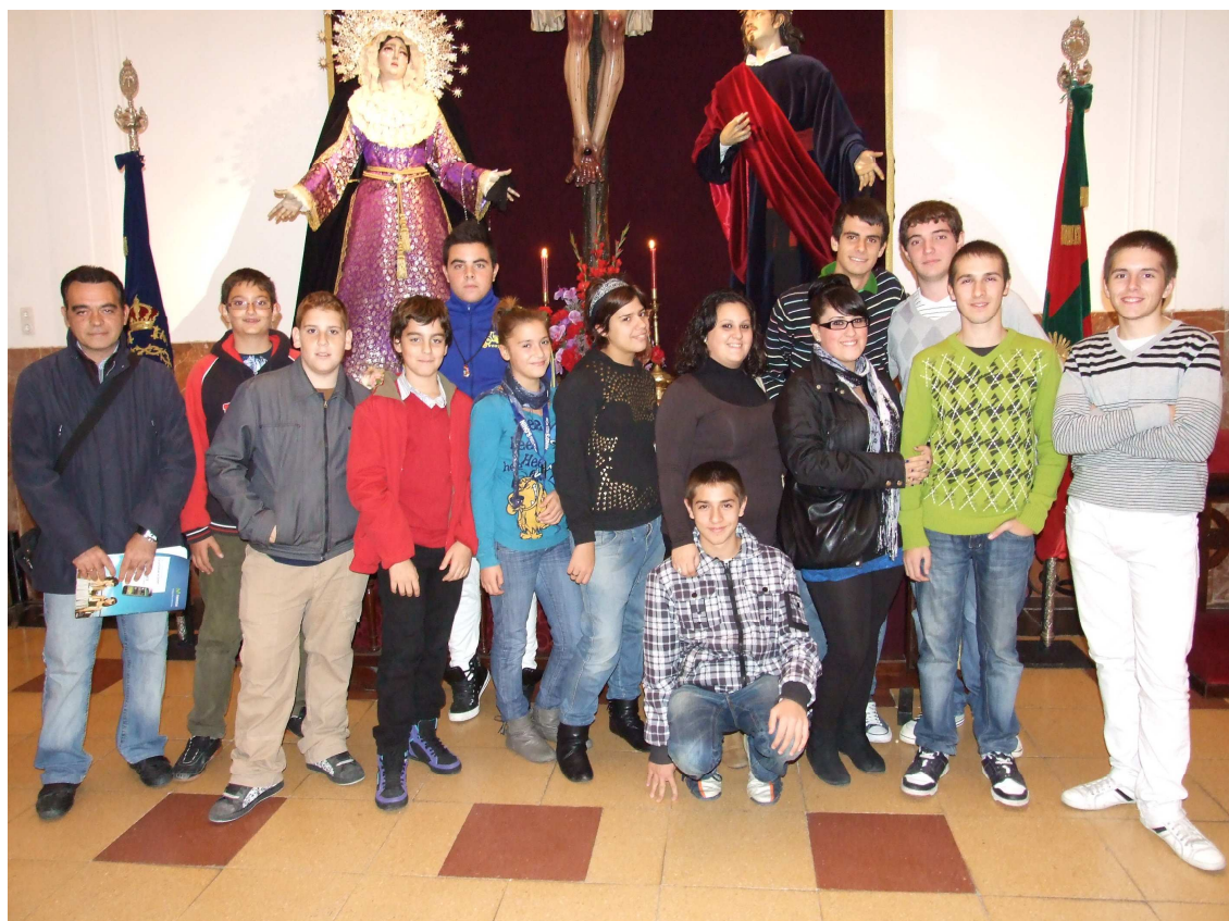
LOS DOS GRUPOS EN UNA FOTO DE LA VISITA ACOMPAÑADOS POR SUS COORDINADORES.

El pasado viernes 19 de Noviembre, nuestro Grupo visitó la Hermandad de las Aguas en su sede de San Felipe Neri en extramuros. Fuimos recibidos por el Hno. Mayor, algunos miembros de la Junta de Gobierno y por el grupo joven de esta Hermandad, con los cuales compartimos vivencias y proyectos de actividades para el futuro. En el transcurso de la visita ofrecimos un ramo de flores a la Virgen, siendo muy fructífero el acto y emplazándonos los dos grupos para comunicarnos nuestras inquietudes e ideas de una forma más cercana. Ya hemos proyectado, en fechas próximas, una celebración en común.