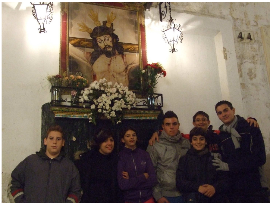
EL GRUPO JUNTO AL MOSAICO DEL CRISTO DE LA MISERICORDIA